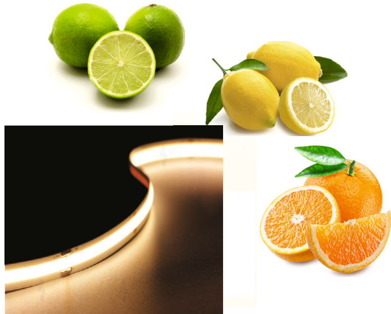
Densità Led: 480 Led/metro